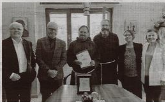
Il Direttivo della Fondazione