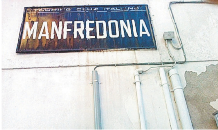
MANFREDONIA La targa del Touring Club di "benvenuto" nella città Manfredonia che è stata rimossa