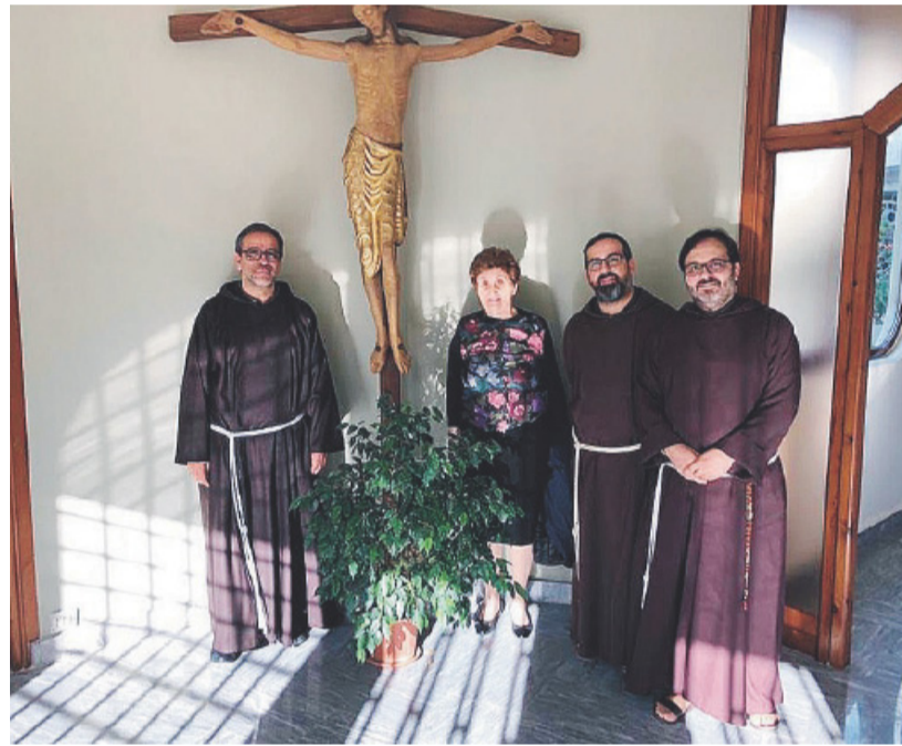
SAN GIOVANNI ROTONDO I quattro nuovi componenti del Consiglio di amministrazione

Il sollievo dalla sofferenza, che ha un suo pilastro portante nell'ospedale Casa Sollievo, trova nella Fondazione Centri di Riabilitazione Padre Pio davvero il suo completamento e la sua piena espressione.